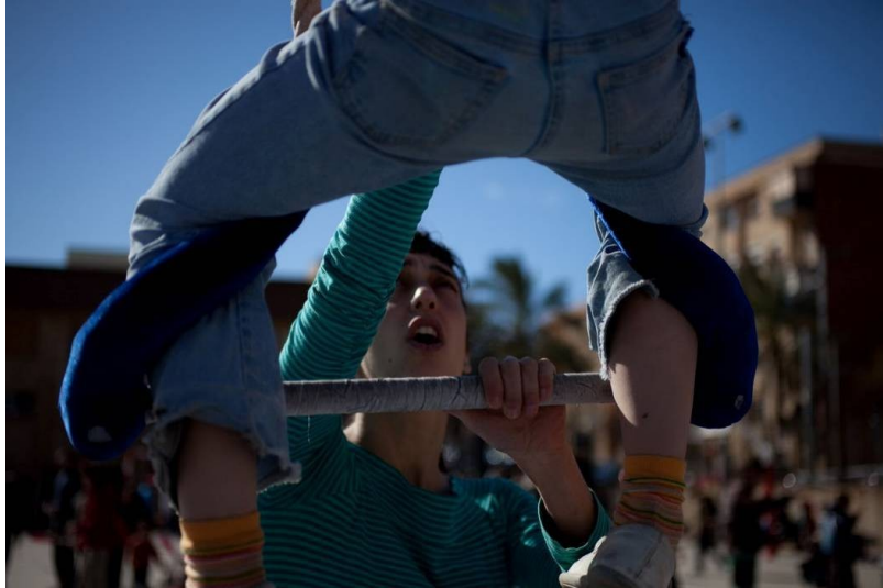
Clase de trapecio a una plaza de Trinitat Nova.